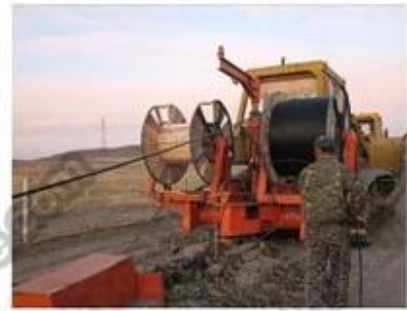
✓ Direct bury