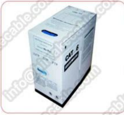
colour pull out box