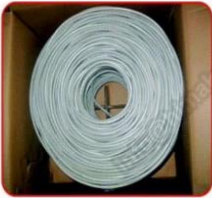
305m/pull out box