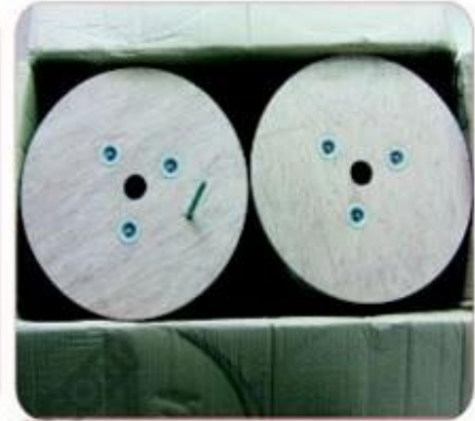
305m wooden reel in carton