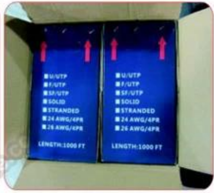
2boxes in carton