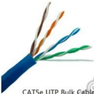
CAT5e UTP Bulk Cable