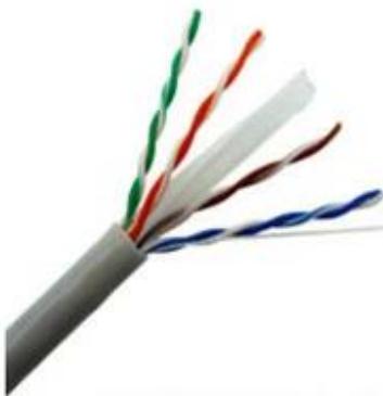
CAT6 UTP Bulk Cable