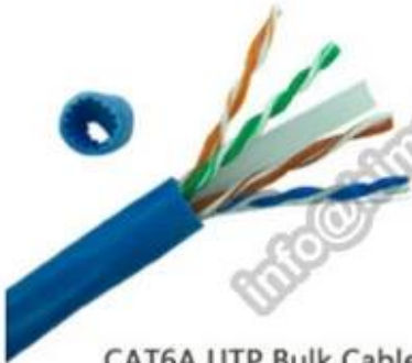
CAT6A UTP Bulk Cable