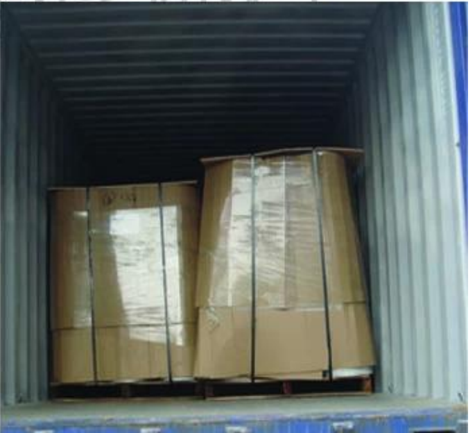
4. 圖 1 至 圖 8 展示了本廠生產的各種規格之鋼絞線及鋼筋之出貨流程及包裝方式。