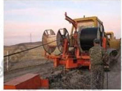
✓ Direct bury